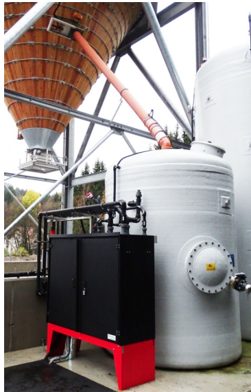
Runder Silo aus Holz auf einem kubischen und feuerverzinkten Stahlunterbau