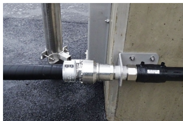
Abzugsstutzen der Soleanlage