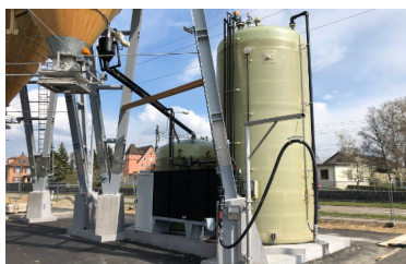
Plate-forme en acier galvanisé à chaud du silo

Trémie de silo avec sac à vent réglable en hauteur, vibreur à balourd et frappeur en bois de chêne