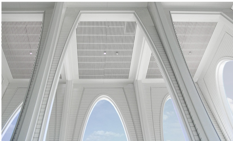
Vue détaillée de l'une des 115 colonnes