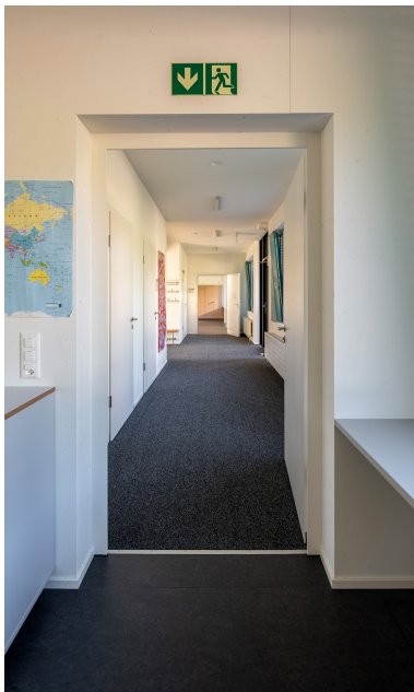
Couloir de l'école dans le pavillon ZM10.