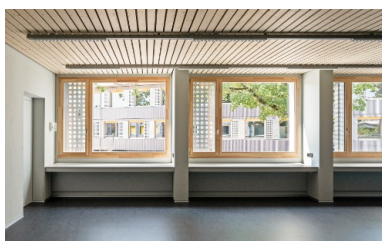
Les grandes fenêtres laissent entrer beaucoup de lumière naturelle dans les salles de classe.