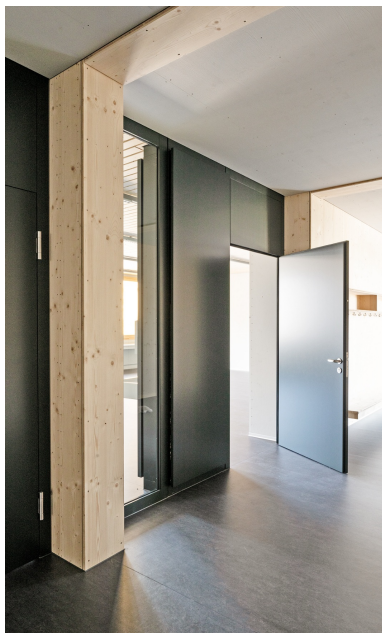
Zone d'entrée du pavillon scolaire construite en bois selon le standard Minergie Eco