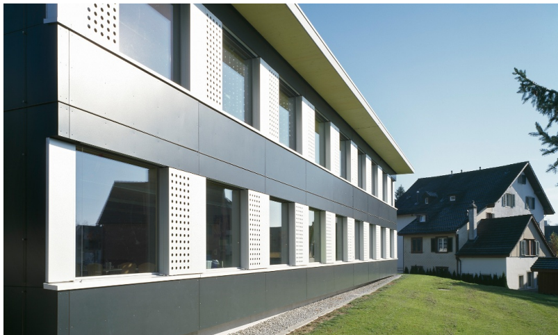
Bâtiment scolaire modulaire temporaire Hasenacker avec façade blanc anthracite