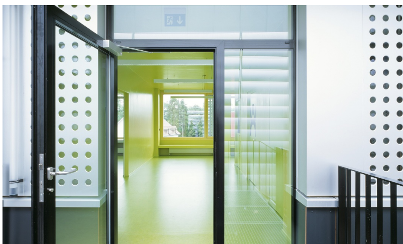
Espace d'entrée spacieux dans le bâtiment d'école temporaire