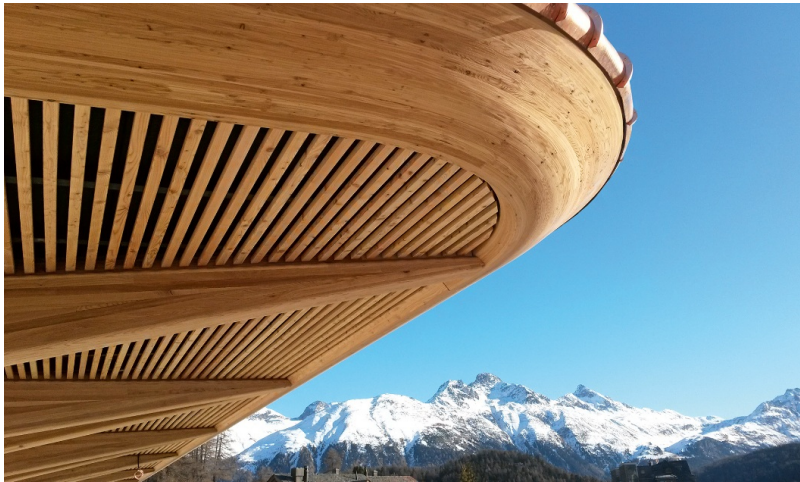
Toiture unique en bois de mélèze