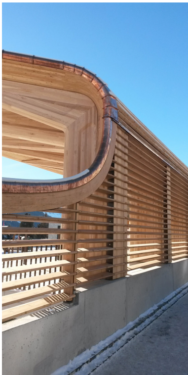
Extrémité de la tribune donnant sur la rue