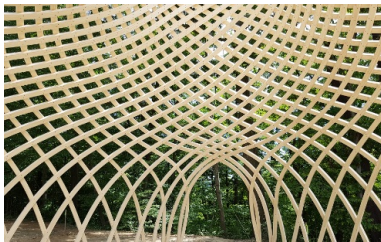
Vue d'ensemble d'un pavillon