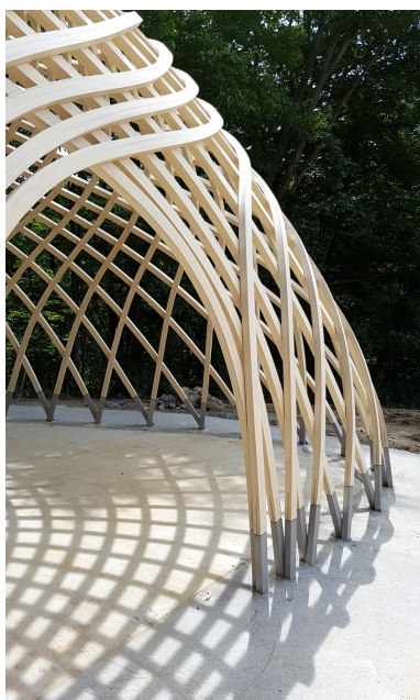
Vue détaillée d'une construction en forme libre