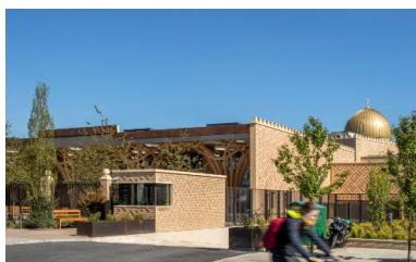
Zone d'entrée de la mosquée