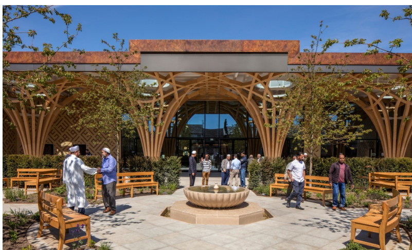
Vue de la cour intérieure de la mosquée