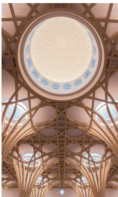
30 lucarnes laissent entrer beaucoup de lumière dans la mosquée