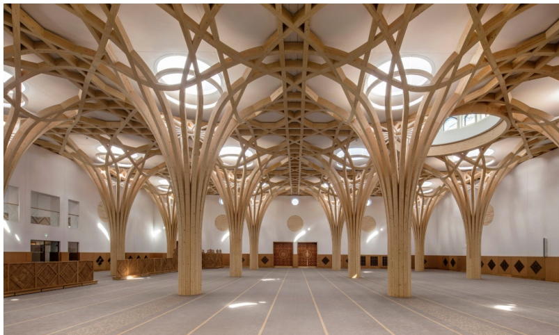
Salle de prière avec structure porteuse Free Form