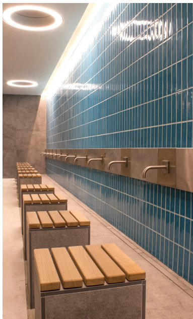
Espace pour le rituel de purification des fidèles