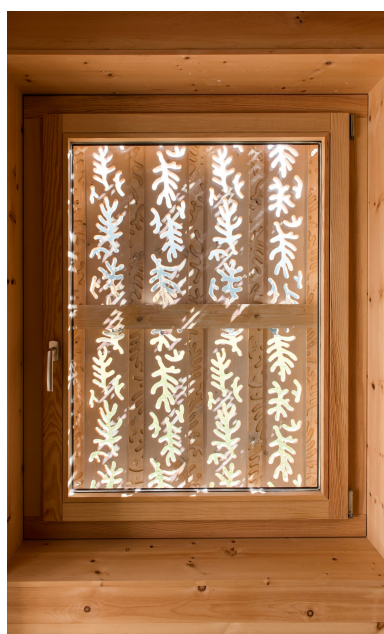
Les ornements de la façade sont également visibles à l'intérieur