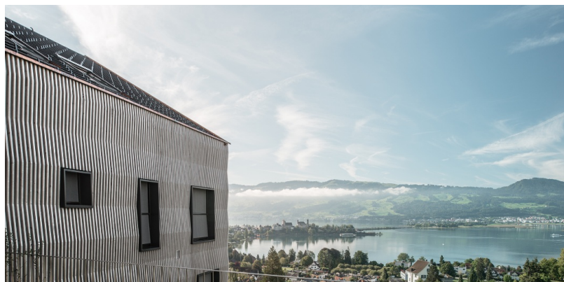
La façade en bois pré-grisé définit l'aspect extérieur