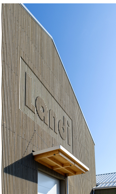
Logo 3D fraisé dans la façade