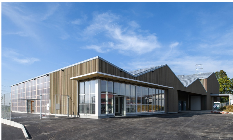
Entrée avec façade vitrée