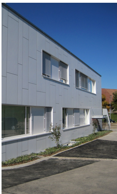
Bâtiment temporaire à deux étages