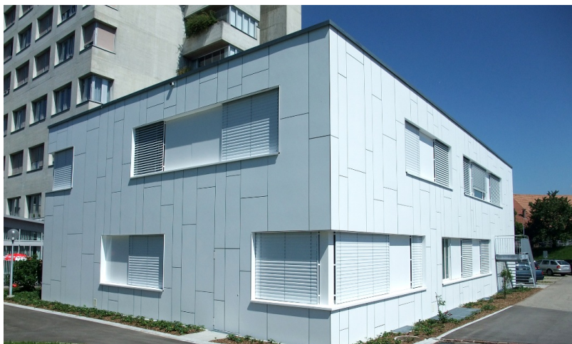
Bâtiment temporaire à deux étages