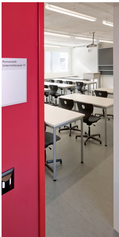
Vue dans une salle de classe