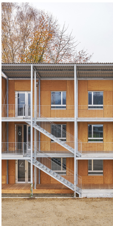
Escalier reliant les trois étages