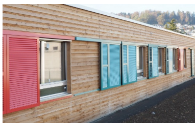
Façade de l'aile nord

info@blumer-lehmann.com blumer-lehmann.com