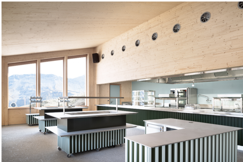
Zone d'accueil du restaurant self-service aménagée en bois massif.