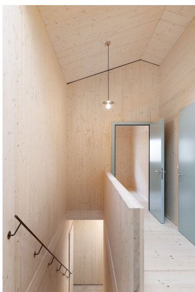
La partie à deux étages du nouveau bâtiment abrite les logements du personnel de l'alpage.