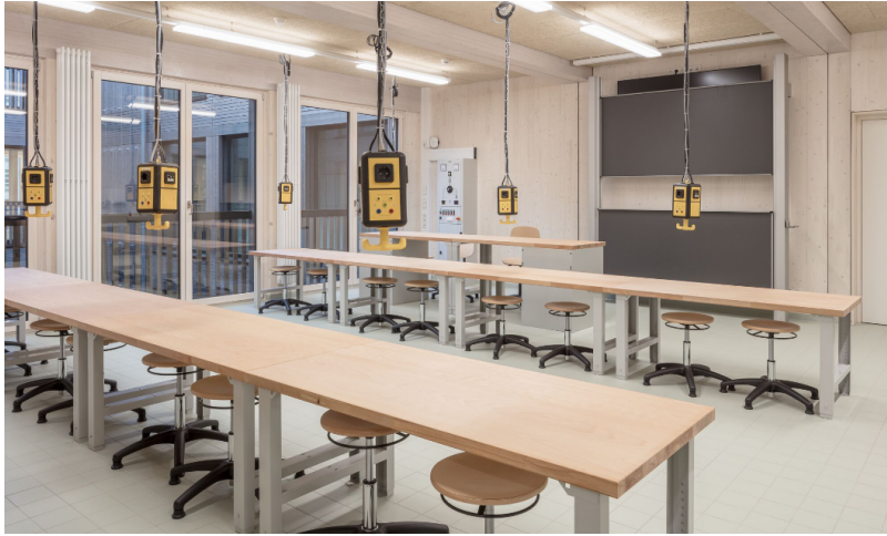
Salle de travail de l'école Schilfweg Dresde