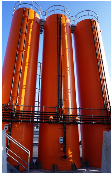
Runde Holzsilos mit Stahlunterbau und orangen Soletanks

Drei orange Soletanks mit einem Fassungsvermögen von je 45m 3