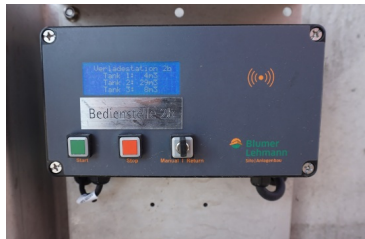
Salzlöseanlage mit einer hohen Löseleistung