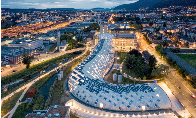
Die 240 m lange Schlange beißt sich ins Dach des Museumsgebäude Cité du Temps