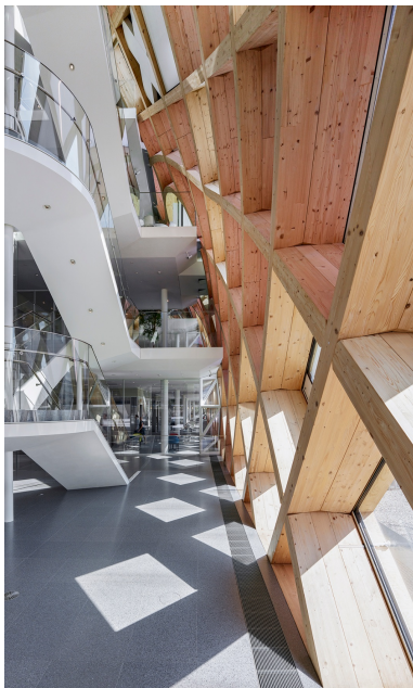
Aus 100% Schweizer Holz wurde die eindruckliche Holzgitterkonstruktion gefertigt