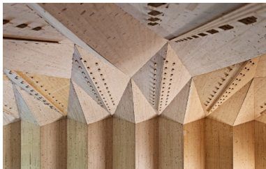
Innenansicht Bestuhlung Théâtre de Vidy