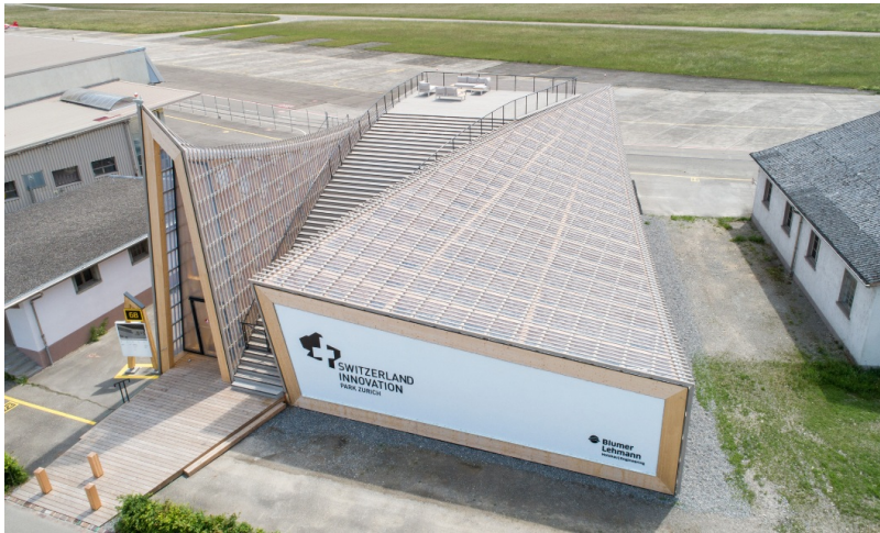
Leuchtturmobjekt für den Innovationspark