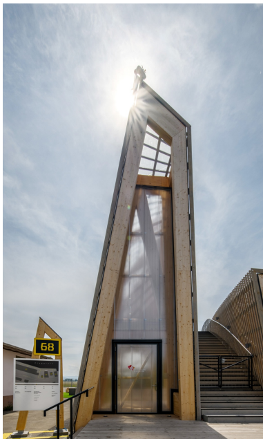
Eingangsbereich in der Free Form-Hülle