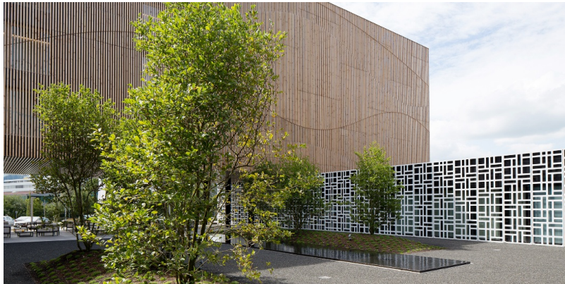
Fassadengestaltung mit vertikaler Douglasienlattung