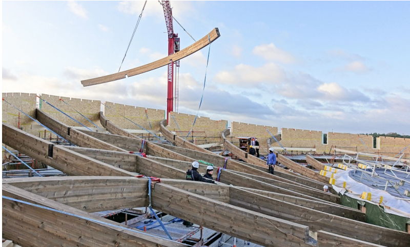
Bauarbeiten an der Tragstruktur