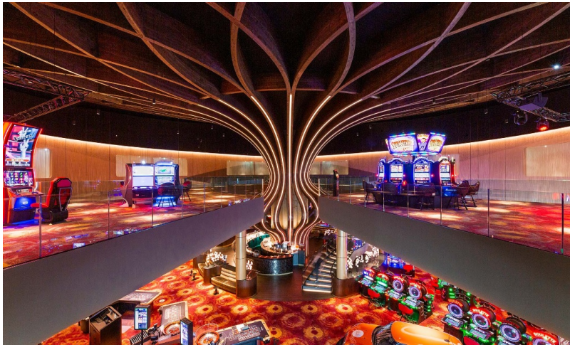
Die freigeformte Säule aus Holz bildet den Mittelpunkt im Atrium