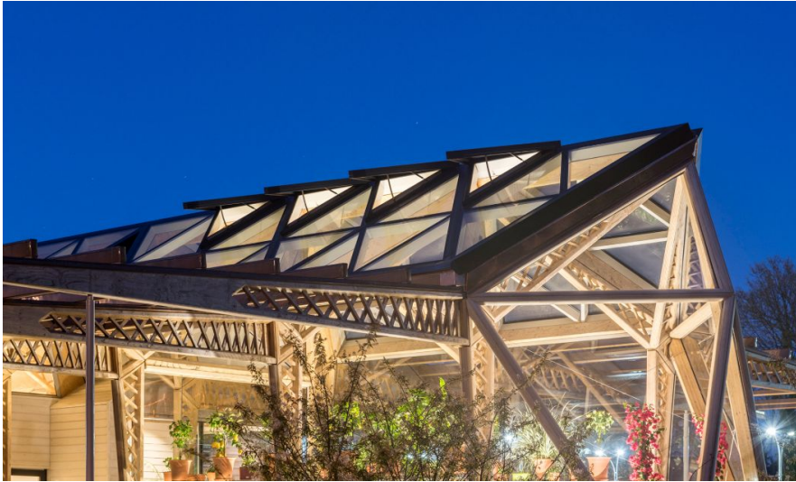
Dachkonstruktion aus Holz