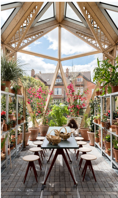
Lichtdurchflutete Atmosphäre im Innenraum