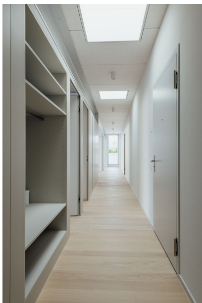
Bürräume und vier Wohnungen finden Platz im aufgestockten Geschoss.