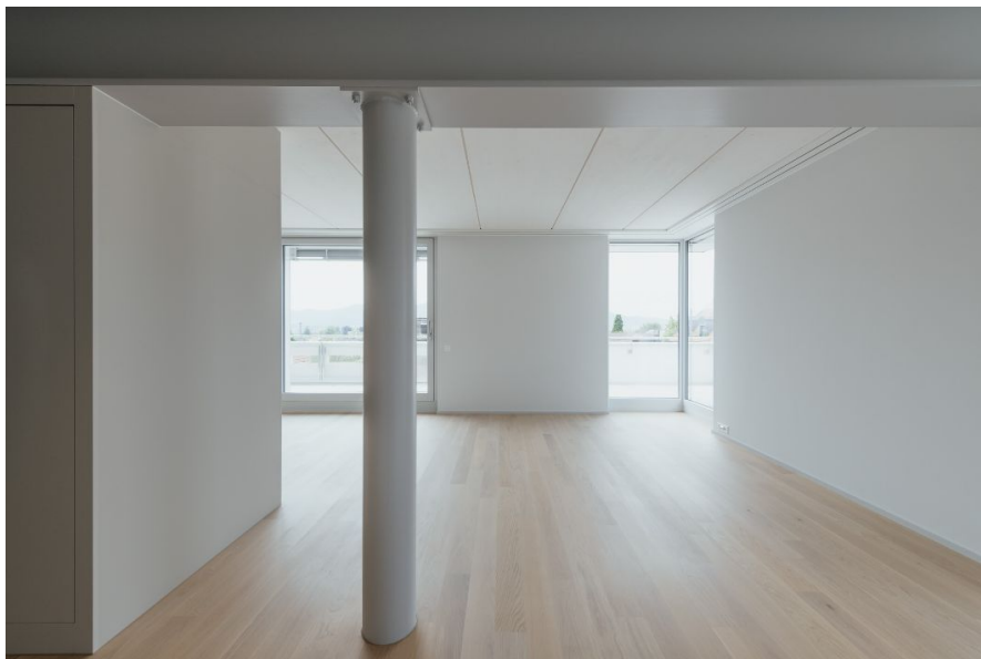
Grosszügiger, hell gestalteter Innenausbau des aufgestockten Holzelementbaus.