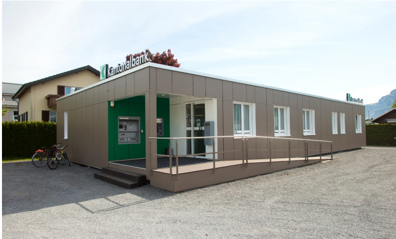
Eingang mit rollstuhlgängiger Rampe